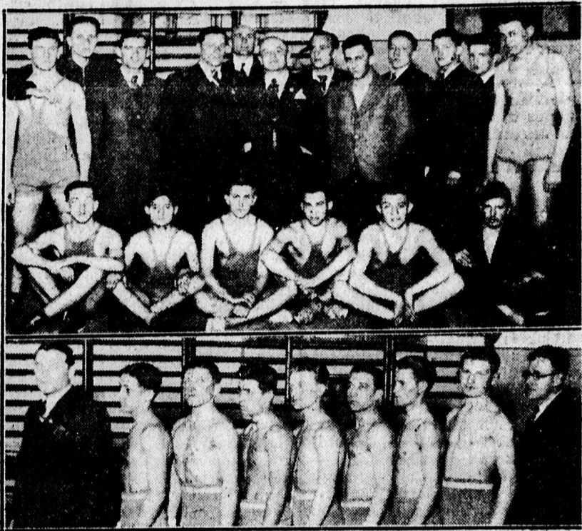
DTE házi birkozóverseny résztvevői és az elnökség. — Alul a boxolók.