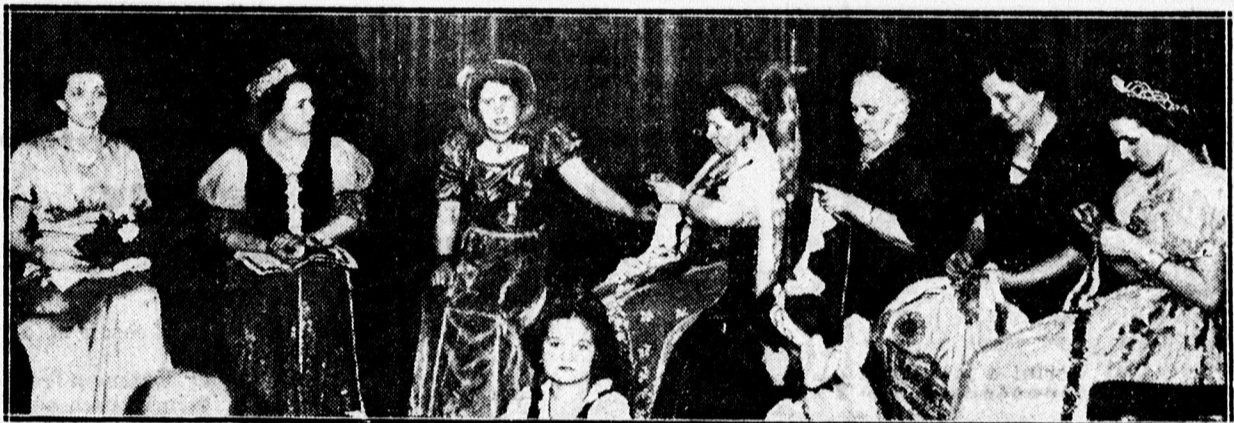
Magyarruhás urhölgyek a Mansz kulturdelutánján családi hangulatot teremtettek.

Százezrek kiáltása tör a napfényes ég felé, miközben XII. Pius fején a tiarával, ujján a halaszgyűrűvel Urbi et orbi áldást oszt