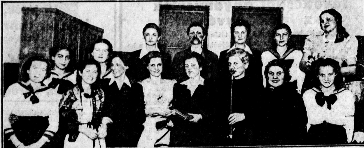
Dóczy önképzőkör előadásának szereplői.

ketten egy jeggyel Legyen úgy mint régen volt