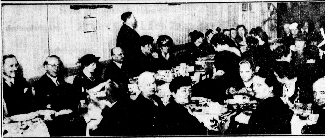
A Vasutas Mansz társasvacsorájáról.