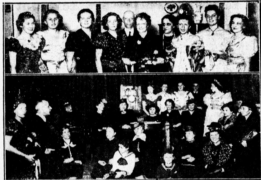
A Mansz antik bútor-, óra- stb. kiállításának záróünnepélyéről.