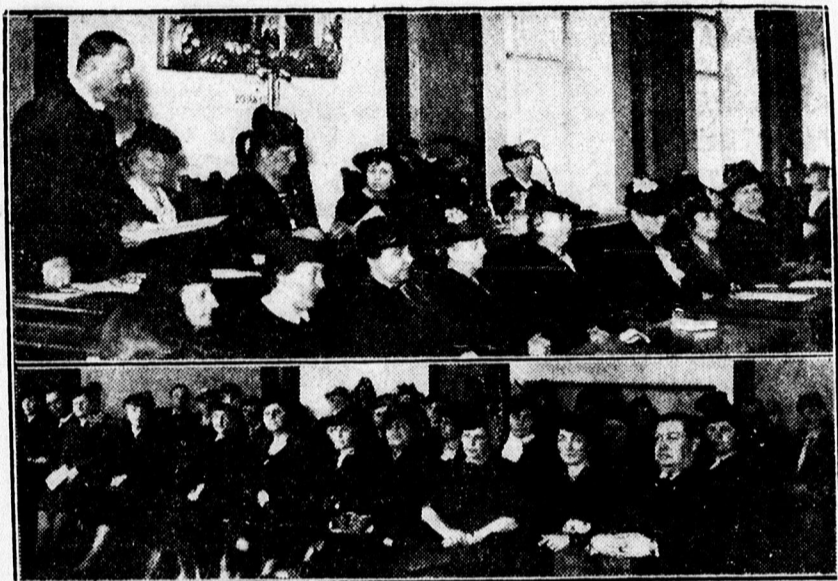
A Mansz közgyűléséről.