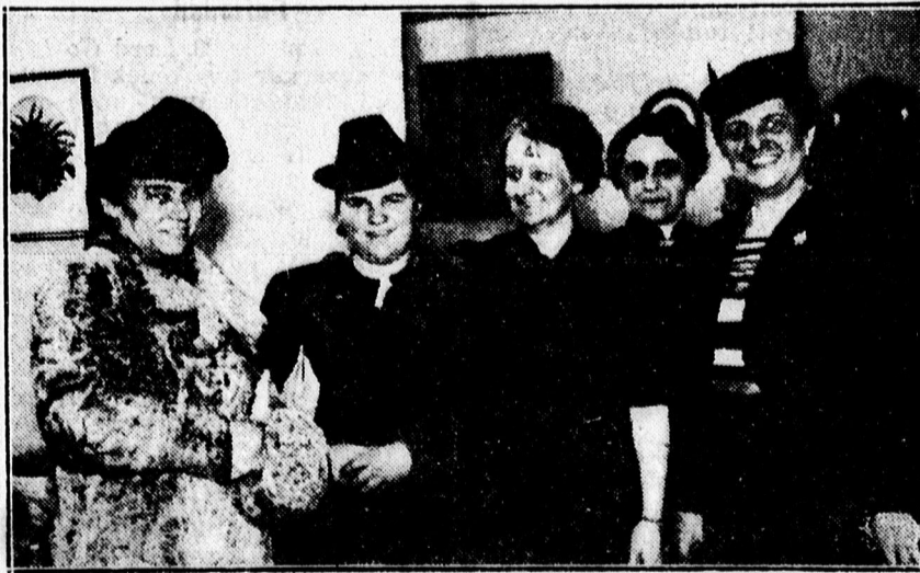
A debreceni MANSZ vendégei a kiállításon.

1. Március 11.: Cseh-Szlovákia még független állam. — 2. Március 12: Németország bekebelezi Cseh- és Morvaországot. Szlovákia és Kárpát-ország önállóságát mondja ki. — 3. Március 22.: Németország annektálja Memelt. Magyarország visszafoglalja a Ruténföldet. — 4. Március 23.: Németország védelmi szerződést köt Szlovákiával és semlegesíti Litvániát. 5. Március 24.: Németország öt éves szerződés megkötésével irányító szerepet kap Románia gazdasági életében