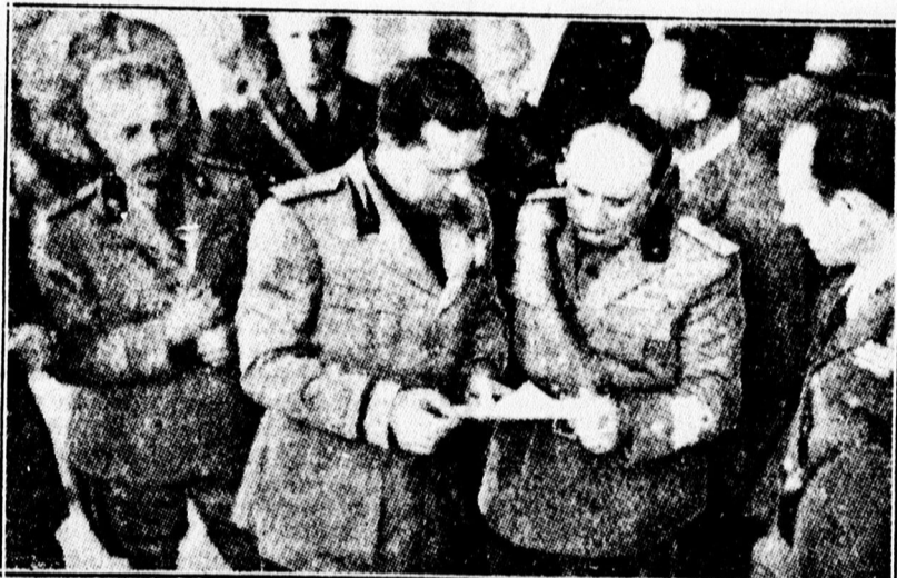
Ciano külügyminiszter Guzzoni tábornokkal Albániában.

Róma, április 11. A san giovanni di medua kikötőben partraszállott olasz csapatok bevonultak Szku- tari városába. Utban Szkutari felé az egyik szűk hegysorosban ellen- állás jelentkezett albán bandák ré- széről, az olaszok azonban hamarosa- san megtörték az ellenállást és to-