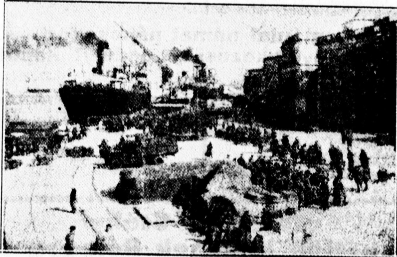
Olasz csapatok partraszállása Albániában.