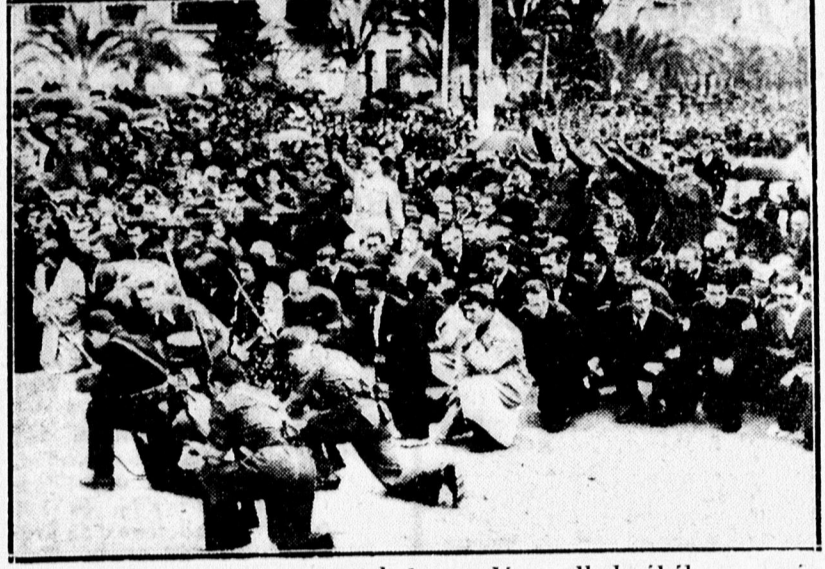
Alicanteban a spanyol nemzetiek bevonulása alkalmából az úccan hálaadó misét mondtak.