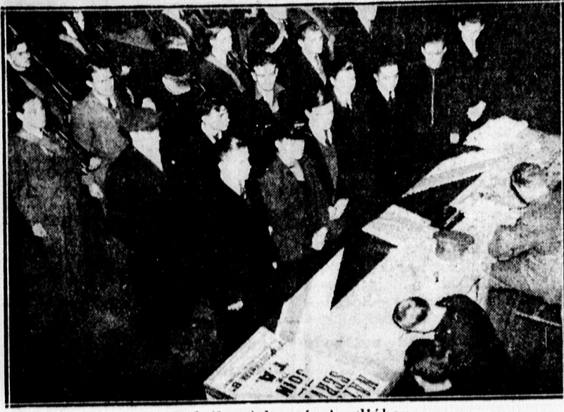
Folyik a toborzás Angliában.