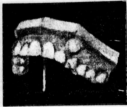
A rekonstruált fogor.