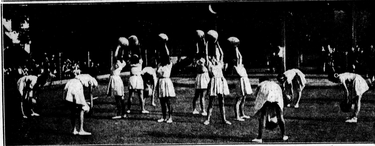
Fent: A Dóczy polgári iskola tornavizsgáján nagy sikerrel szerepelt tánc-csoport. Lent: Labda-gyakorlat a Dóczy polgári iskola tornavizsgáján.