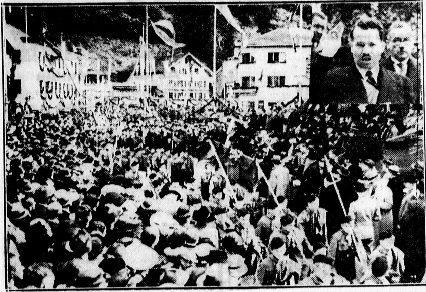
Vaduzban, Lichtenstein hercegségfővárosában Lichtenstein herceg leteszi az esküt az alkotmányra. Képünk felsőbb jobb sarkában Lichtenstein hercege eskütétel közben.