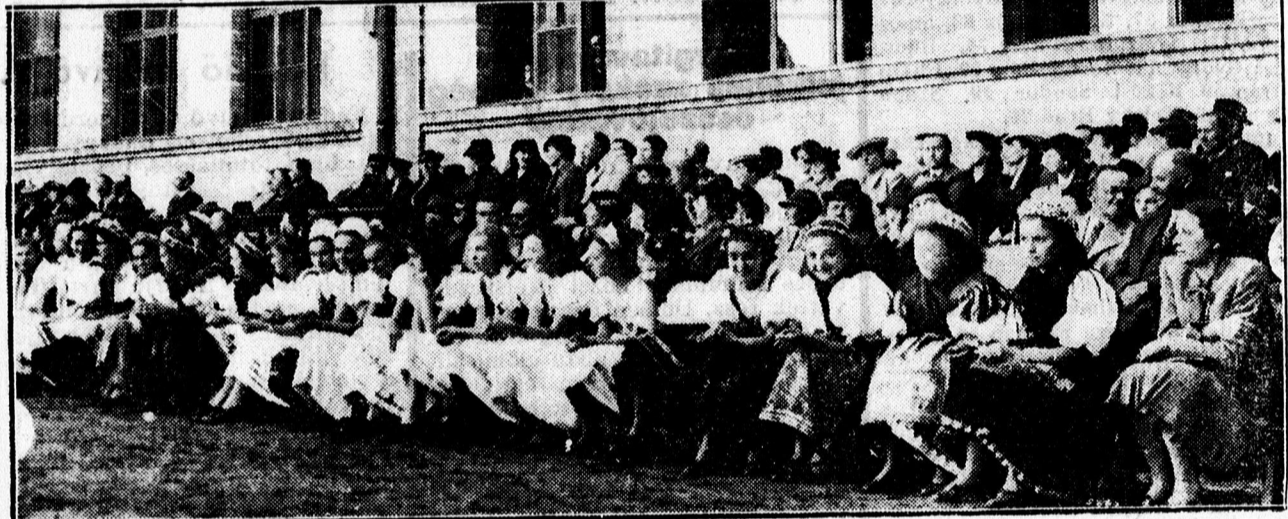
A női kereskedelmi iskola növendékei, kik a református gimnázium tornavizsgáján szerepeltek.