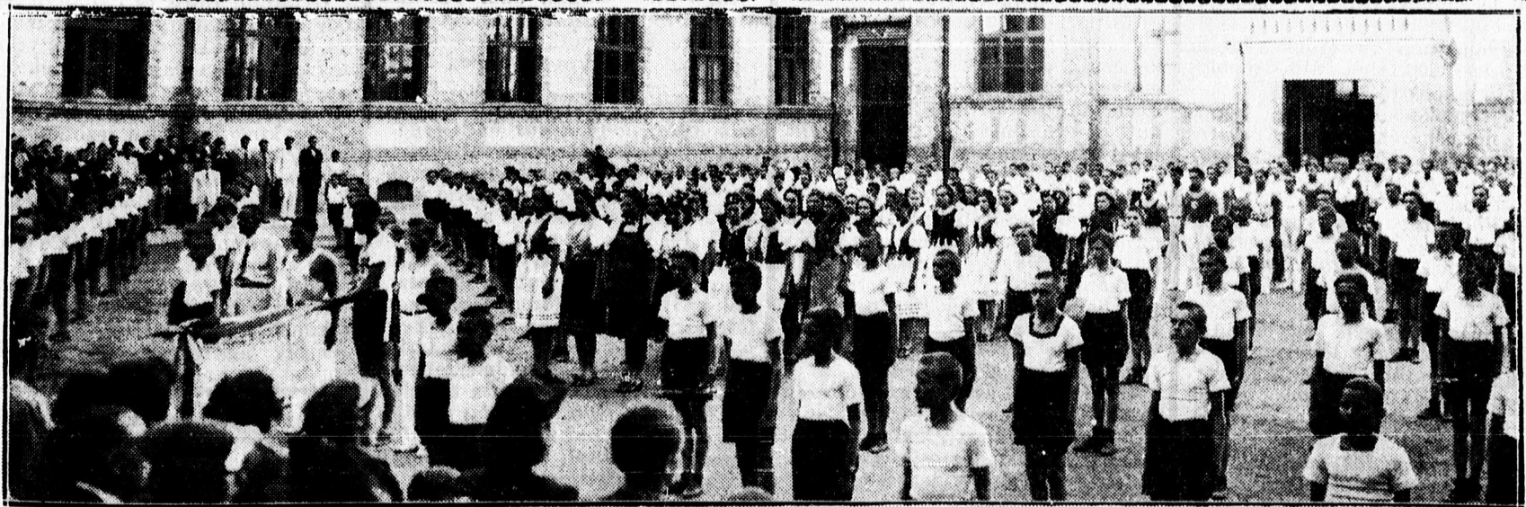
Ref. gimnázium tornavizsgájáról.