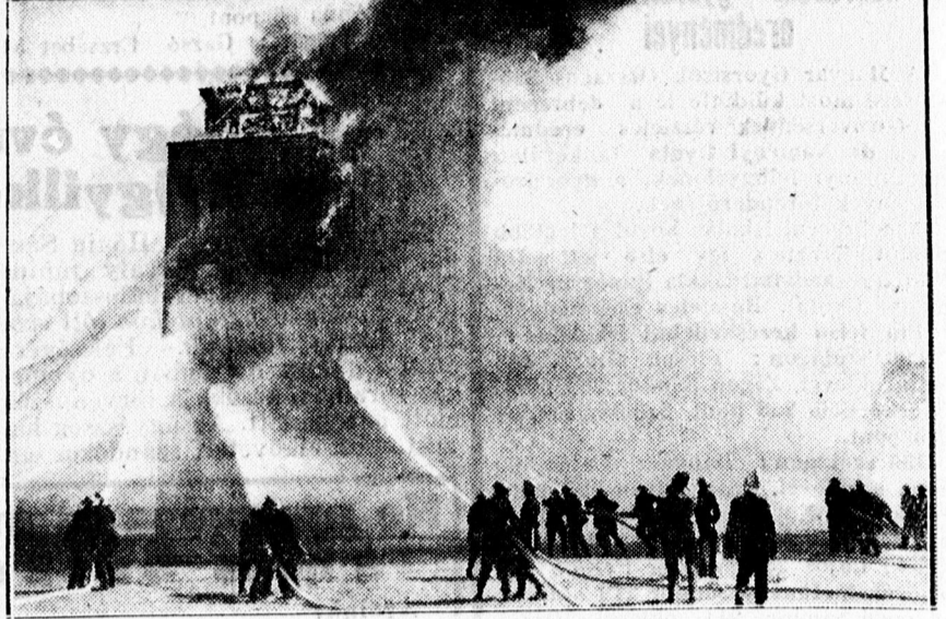
A nagy amerikai moztűz, ahol 60 ember életét veszítette.