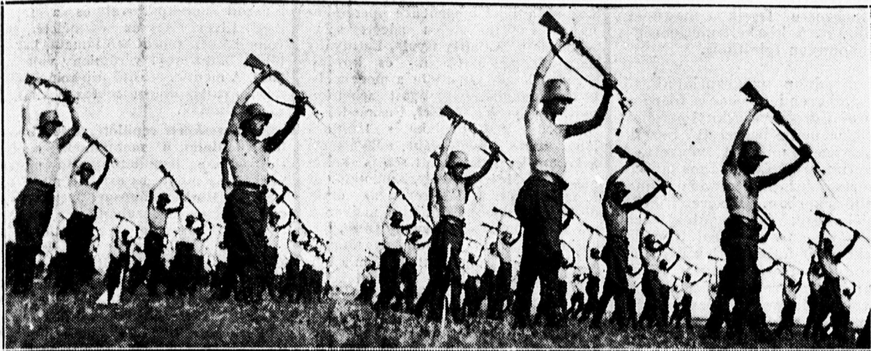
A Honvédnap egyik legszebb száma a 600 főnyi honvédség szabadgyakorlata.

Felejthetetlen élményben volt része a közönségnek. — Az ifjúság és a honvédség nagyszerű felkészült seregéről tanuskodott a Honvédnap