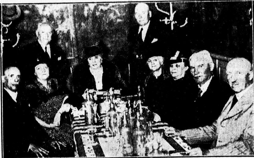
1894-ben Késmárkon érettségizettek 45 éves találkozójukat itt tartották az Angolban.