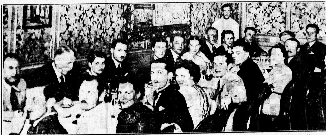
A Keresk. Iskola 1929. évben végzett növendékeinek 10 éves érettségi találkozója az Angolban.