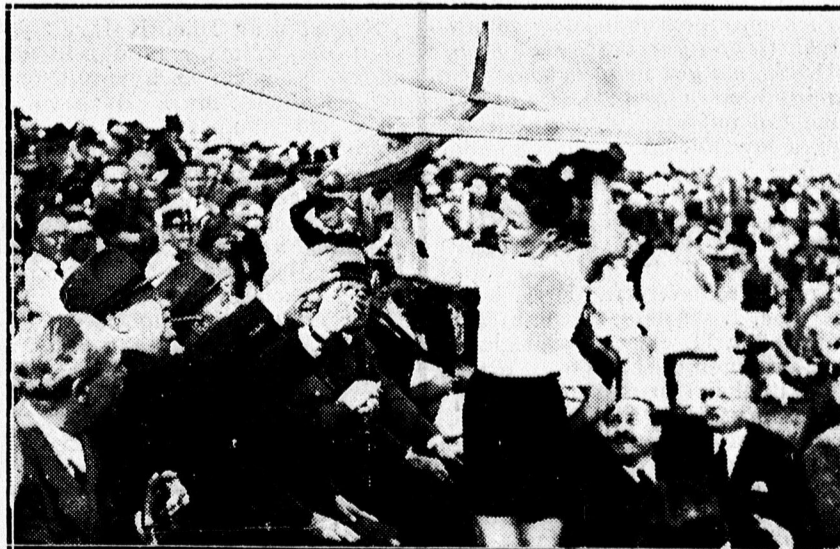
Középiskolások repülőmodell-versenyének győztese és gépe.