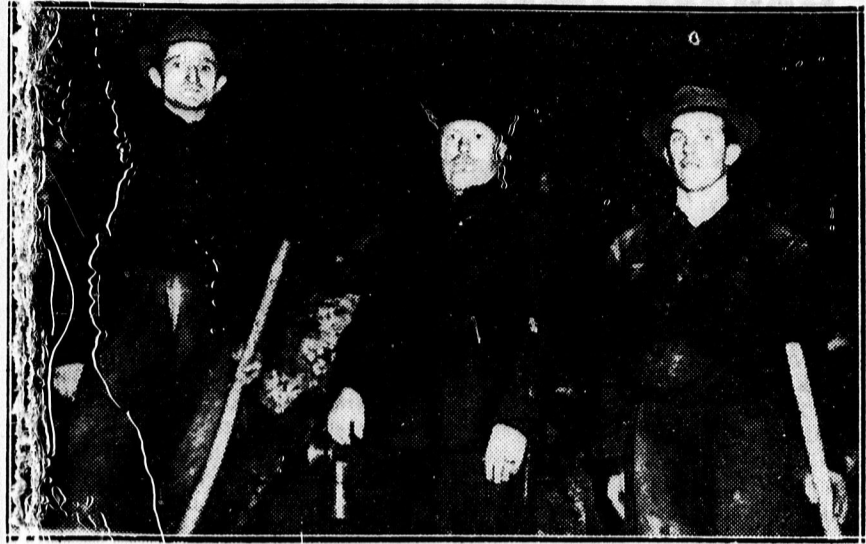
Mussolini Turinban bányászöltözetben leszáll a bánya mélyére a munkások közé.

EREJÉT fokozza, üdíti, frissíti a nagyerdei csónakázás!