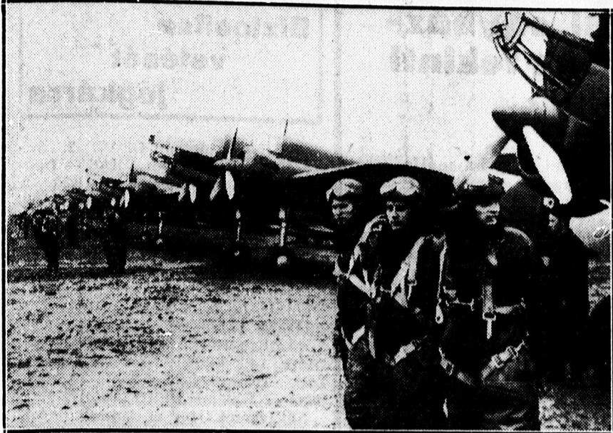
A lengyel légiflotta gyakorlatozásra készen.