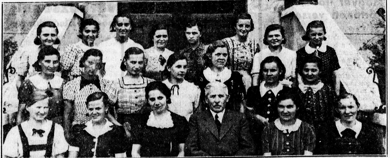
A siketnéma intézet varrótanfolyamának növendékei.