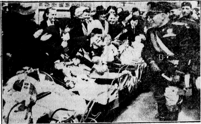
Mussolini „szemléltja” Romában a gyerekek között.