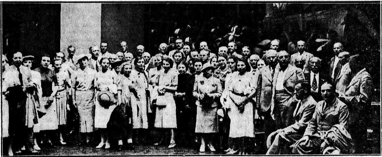
Az erdész kongresszus résztvevőinek egy csoportja a Déri múzeumban.