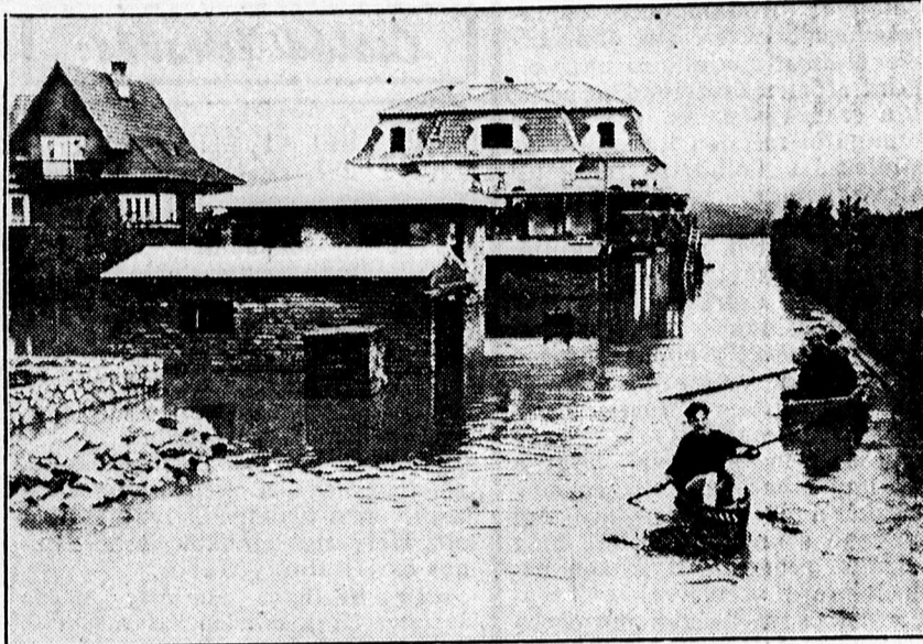
A csehországi nagy árvíz után Prága külvárosa.