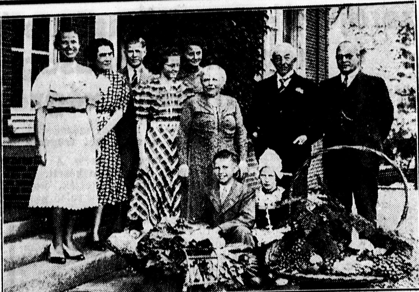
A 79 esztendő holland miniszterelnök gyermekei és unokái körében.