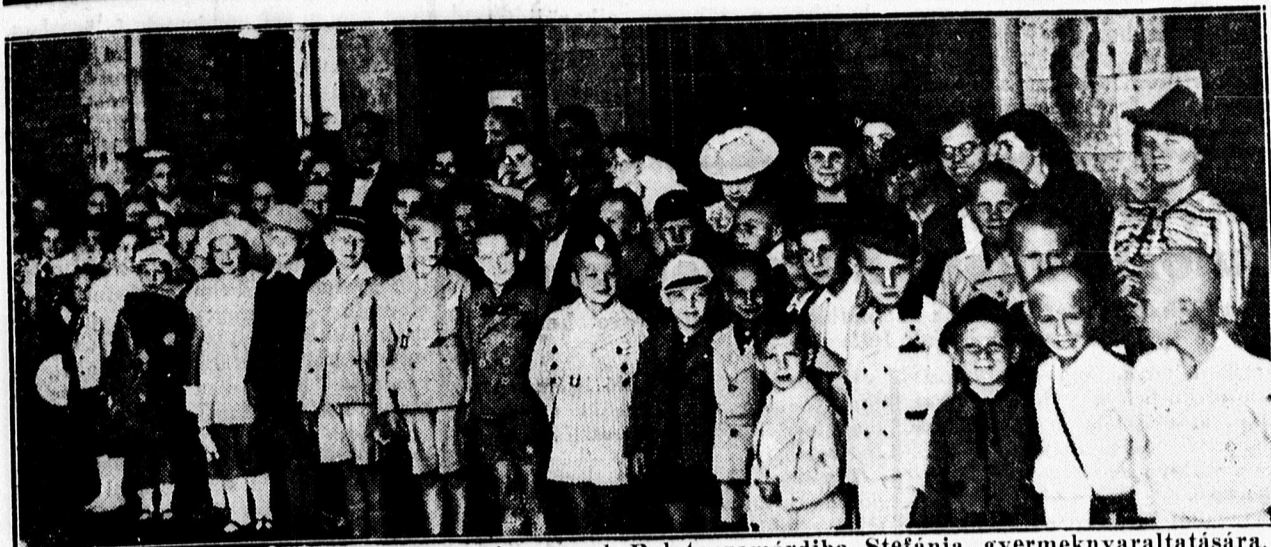
Tegnap reggel indult el 64 debreceni gyermek Balatonzamárdiba Stefánia gyermekuyaraltatására.