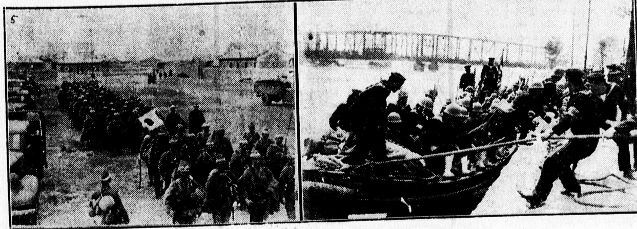
Japán csapatok a tűzvonal felé menetelnek. — Japán katonák partraszállása.