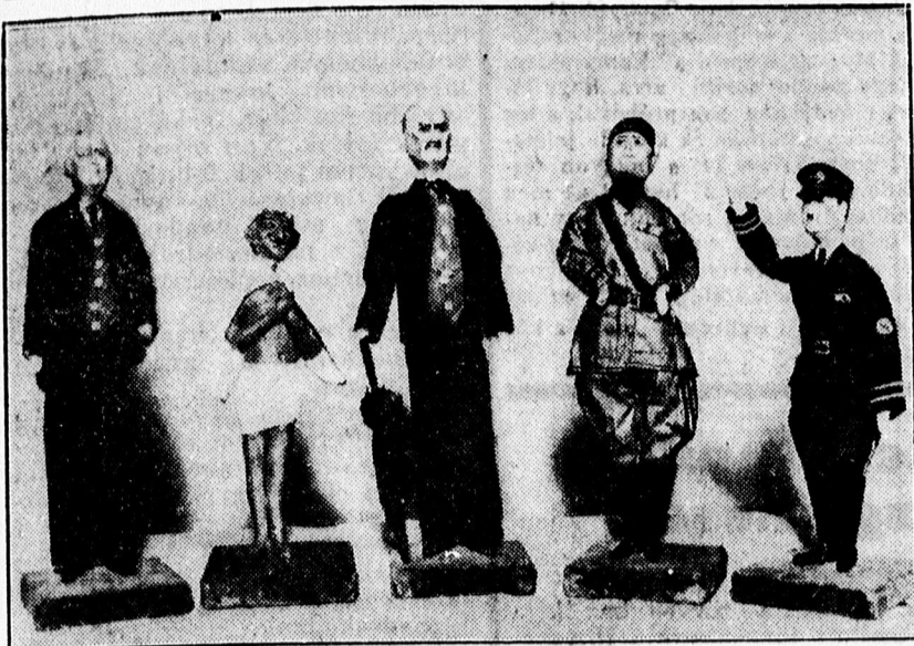
Egy amerikai babakiállítás a mai politikai élet nagyjait készítette el játékszerként. Sorrendben: Roosevelt, Ghandi, Chamberlain, Mussolini és Hitler.