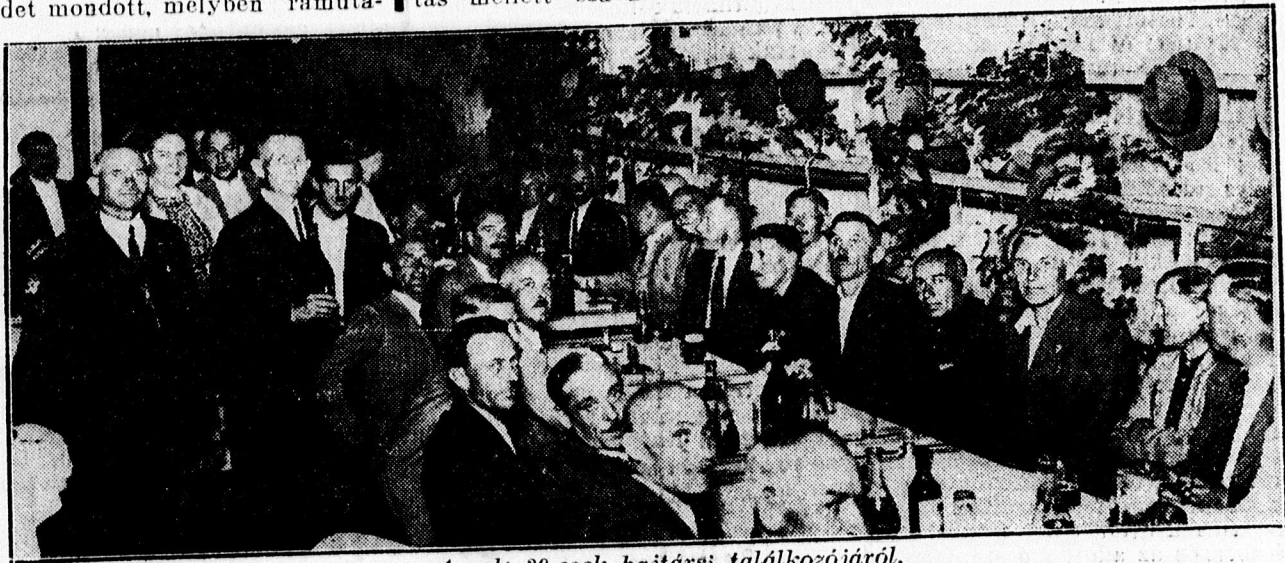
A volt 39-esek bajtársi találkozásáról.