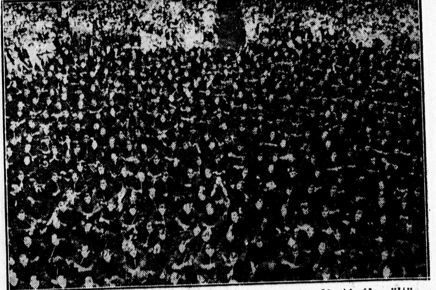
Amerikában a Yale-i egyetem diákjai az év végén dísztagába öltözve, pipával jelennek meg az évszázó ünnepélyen.

— Artistaszerencsétlenség egy bécsi cirkuszban. A bécsi Práterben egy szabadtéri cirkuszi előadásban súlyos szerencsétlenség történt. — Koseány trapézművész nő mutatóványa közben kiléte méter magasságból lezuhant és súlyos sérülésekkel szállították kórházba. A szerencsétlenséget az okozta, hogy az akrobatának partnere, elvakítva a szemébe tűző naptól, ellevesztette a fogást és nem kapta el idejében a feléje repülő nőt.