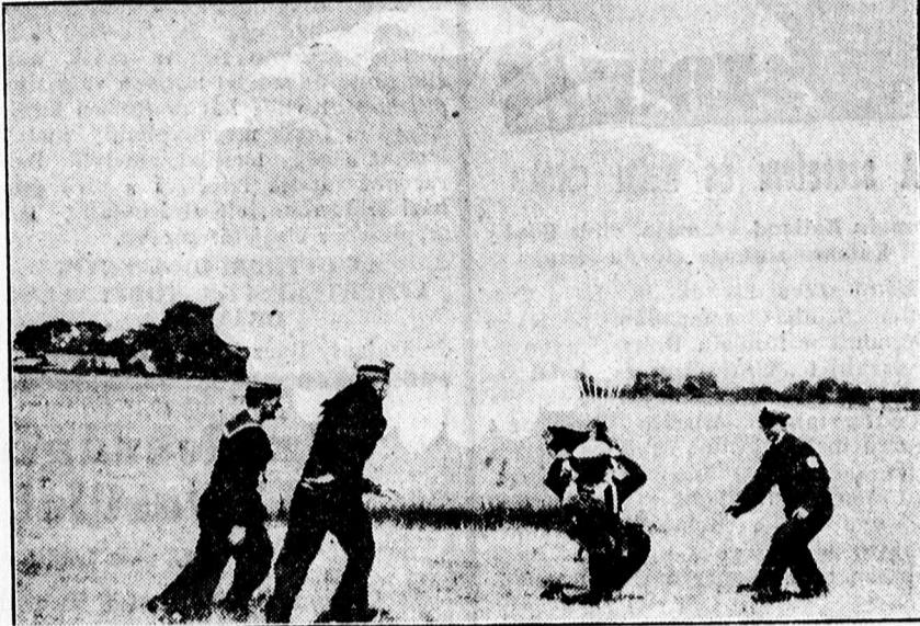
Angol pilóták ejtőernyő gyakorlata.