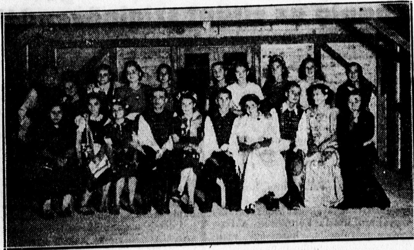
„El kén indulni, meg kén házasodni“ című zenés népi játék szereplői a Méliusz cserkészcsapat ünnepélyén.