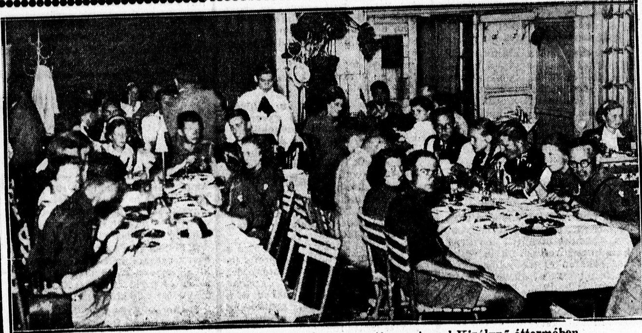
A varsói egyetemi hallgatók cserkészcsoportha az Angol Királynő éttermében.

Az angol légi haderő egységei baráti repülésre mennek Lengyelországba. A repülésben nagyszámú gép fog részt venni. Az angol bombavető rajok repülésének állítólagos célja meggyőzni Oroszországot, hogy Anglia kész teljesíteni magára vállalt kötelezettségét.