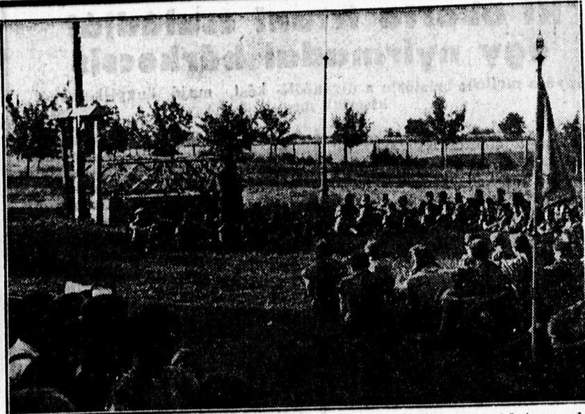
Zsigó Károly cserk. kerületi ellenőrző tiszt avatási beszédet mond a Méliusz cserkészcsapat avatási ünnepélyén.