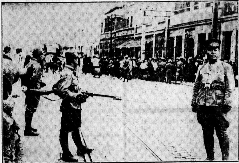
Tiencinben japán katonaság és kínai rendőrség vigyáz a nemzetközi negyedre.