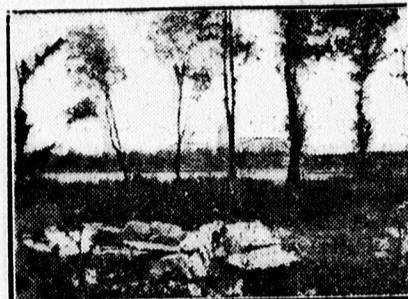
Máramarossziget szélső házai