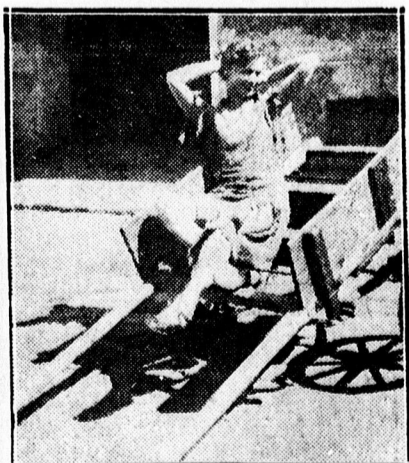
saját kéthengeres kiskocsiján