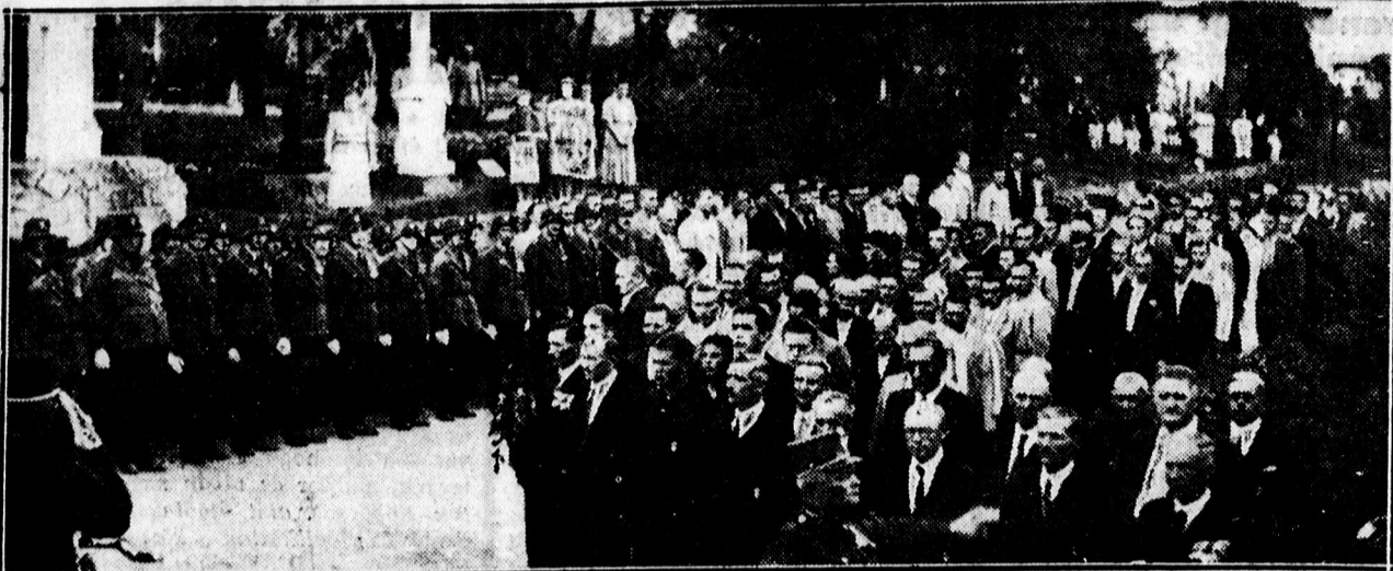
A debreceni csata évfordulóján megjelent kiküldöttek egy része.