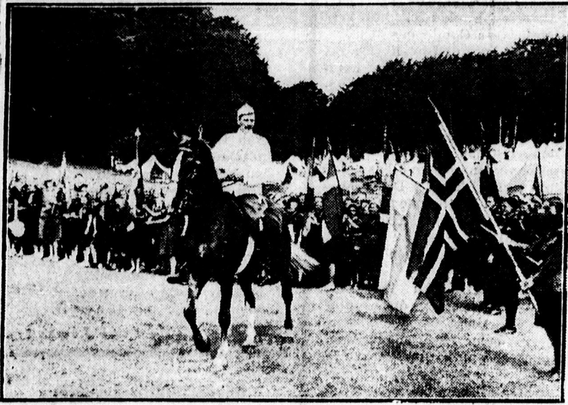
A dán király a dán leánycserkész táborban 2800 cserkészlány között