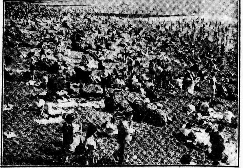
Az elmúlt heti nagy hőség alatt így strandoltak a londoniak a tengerparton.