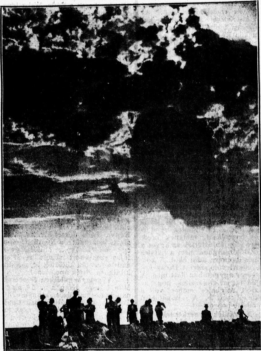
A zivatar közeledtét nézik a külföldiek a Hortobágyon.