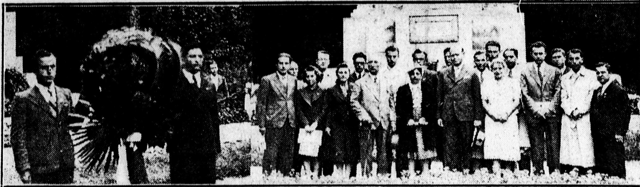
A Nyári Egyetem török hallgatói megkoszorúzták a 39-es hősi emlékművet.