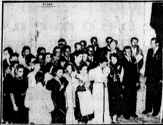
Lengyel csoport a Nemzetek Ünnepeén.