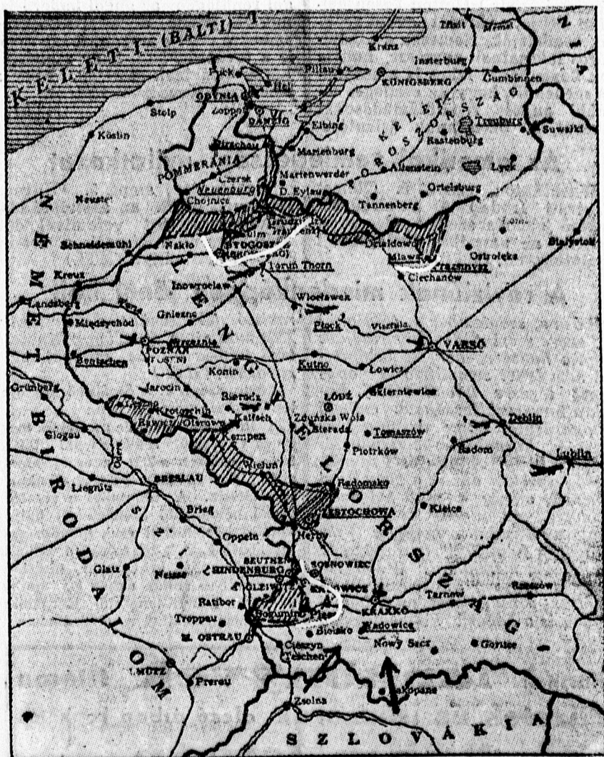
A lengyel hadszínterről. A sűrűn vonalozott rész a németek által hétfő délig megszállt terület, a fehér vonallal aláhúzott részek a kedd délig elfoglalt területek.

Wilhelmshaven, szeptember 5. (Német Távirati Iroda.) Hétfőn délután hat óra tájban angol nehézbombavető repülőgépek támadást intéztek Wilhelmshaven és Cuxhaven ellen.