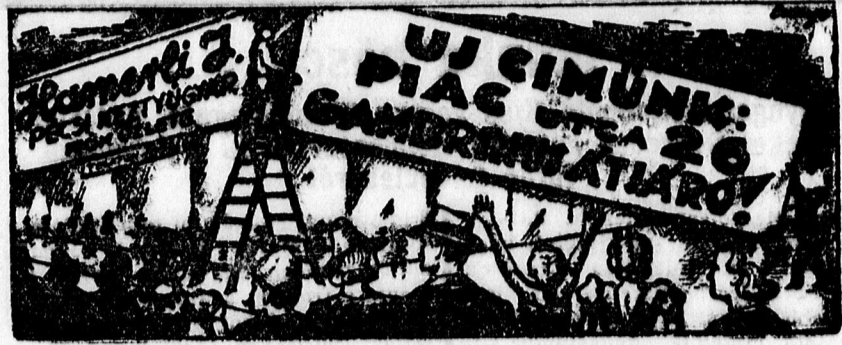
Divatos bőrkesztyűk megérkeztek már 2-60, 3—, 3-50-től

A Magyar Filmirodában most készül a nyári szezon utolsó filmje. Az Atelier filmvállalat forgatja Hunyady Sándor Eb ura fákó című kutyatörténetét, amely az első eredeti filmre frott Hunyady-szűszé. Érdekes, hogy az illetékes hatóságok valóságos megrohanás-