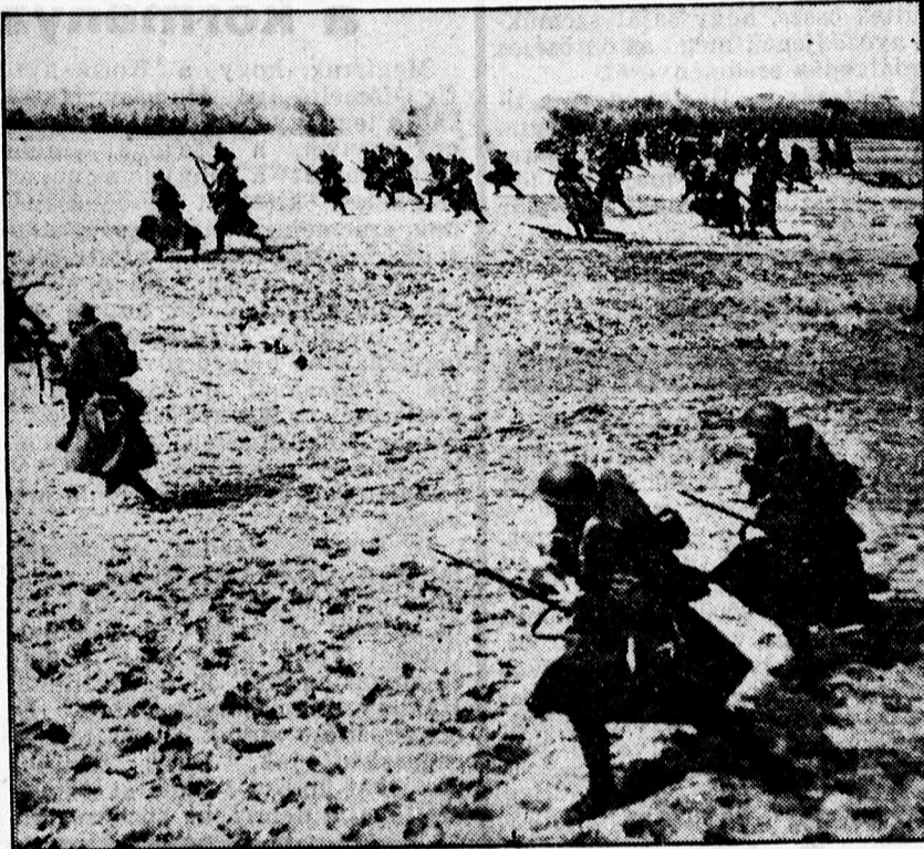
A keleti hadszínterről. Lengyel gyalogság.

— A legkiválóbb magyar írók novelláin, a rendkívül érdekes cikkek dús során és a nagyszerű folytatásos regényen kívül nagy keresztretjtvényt és több mint félszáz pompás képet talál az olvasó a népszerű képeslapban. Tolnai Világlapja egy száma 20 fillér.