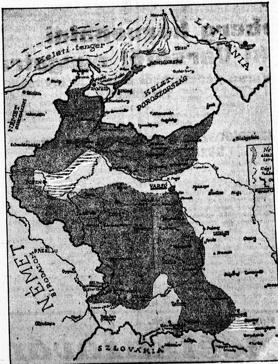
A vékonyan vonalozott rész a német csapatok tegnapi tényere.

apatok gyülekezését. Több kötelék támadást intézett a Varsó melletti pragai vasúti háromszög, valamint a Varsótól Radyzin, Tiuszcz, Siedlce és Deblin felé vezető vas-