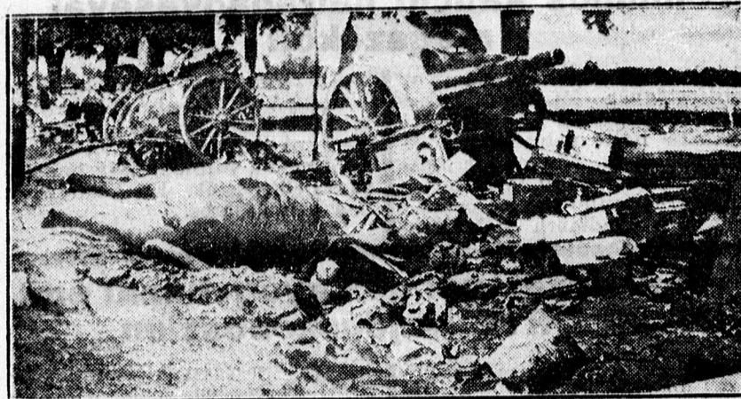
A lengyelországi harcokból. Széltöltött lengyel úteg.