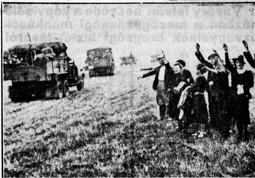
A német sereg osztagait üdvözik visszatérésük alkalmával.

egy eltűnt, de halottnak tekinthető és húsz eltűnt. Az első veszteségjelentés 17 eltűnt nevet tartalmazta.