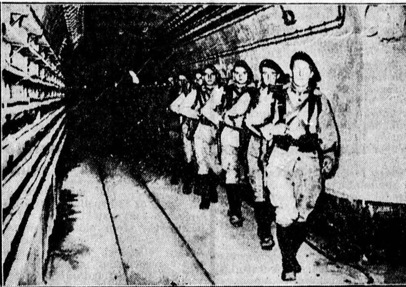
A francia Maginot-vonal földalatti folyosója.