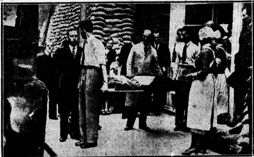
Egy kórház kiürítése Londonban

Budapest, szept. 28. A MÉP-nek az egyesített bizottsága csüktörtökön délután Ivády Béla elnökelével megkezdte a földbirtokpolitikai javaslat részletes tárgyalását. A tanácskozáson résztvevő vitéz Teleki Mihály gróf, földművelésügyi miniszter. A bizottság a javaslat tárgyalását kedden délután 5 órakor folytatta. Az értekezlet után a párt helyiségében pártvacsera volt, amelyen igen nagy számban vettek részt a párt tagjai.