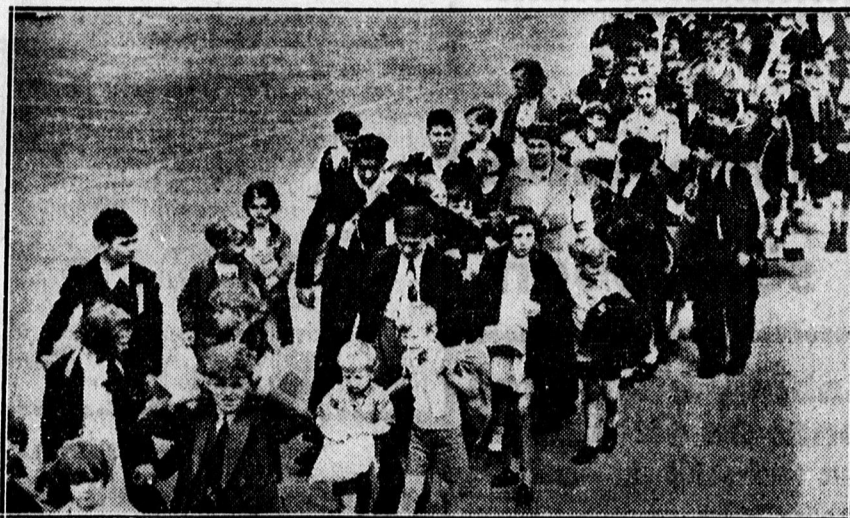
Párisból vidékre szállítják a gyermekeket.

— Zár alá vették a „Mein Kampf” angol kiadásának jövedelmét. Londonból jelentik: Az Ewe-ning Standard jelentése szerint zár alá vették azt a kétezer fontsterlinget, amely Hitler „Mein Kampf”-jának angol kiadásából származott. Ezt az intézkedést az idegen államok alattvalói vagyonát ellenőrző tanács indítványára hozták. (MTL)