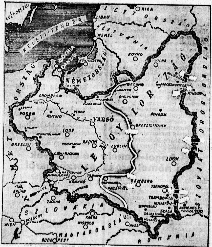
A Moszkvában megállapított német-orosz érdekhatar.

veti. Innen a Pisia folyását követi egészen Ostrolenkaig. Ezután délkeleti irányban folytatódik, míg a Nurnál eléri a Bugot. A Bug mentén halad tovább Krystnopolig, itt nyugatra kanyarodik, majd Rawa-