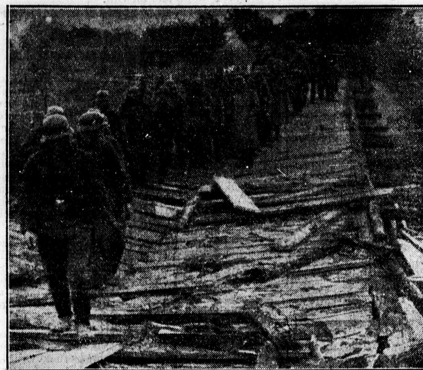
A lengyelországi hadjárat során ilyen rögtönzött hidakon vonultak át a német csapatok.

— A városi zeneiskolában a beirat- kozások délelőtt 9—1 óráig és délután 3—6 óráig. Bővebb felvilágosítás nyer- hető a városi zeneiskola titkári hiva- talában, naponta a fenti időben. A fúvóstanzakra felvételi vizsga f. hó 29-én, pénteken este 6 órákor lesz a Zeneiskolában.