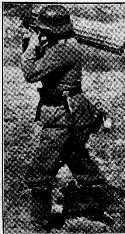
Nehéz gránátot visz az ágyúhoz egy német tüzer.

— Egyik északangliai lőszer- gyárban robbanás történt csütörtökön. A robbanásnak 15 halottja és négy sebesültje van.