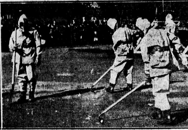
Fent: A debreceni kerékpáros polgári gázvédelmi osztag nagyszerű bemutatót rendezett P. Ladányban Lent: Foszfór-bomba robbanás pillanatában. — Gázfelderítő osztag munka közben.