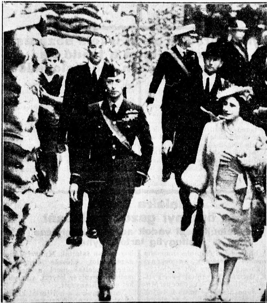
Az angol királyi pár meglátogat egy kórházat, mely homokzsákokkal van körülvéve.

gondoskodik. A kamara tagja az lehet, aki jelenleg is tisztviselői munkakört tölt be, akinek legalább érettségije, vagy ezzel egyenrangú végzettsége van és végül akit a kamara felülvizsgáló bizottsága a tagságra alkalmasnak talál. Az utóbbi lehetőséget főként a nők érdekében állították fel. A kamara lesz a jövőben az az ellenőrző szerv, amely hivatott a törvények betartását felülvizsgálni.