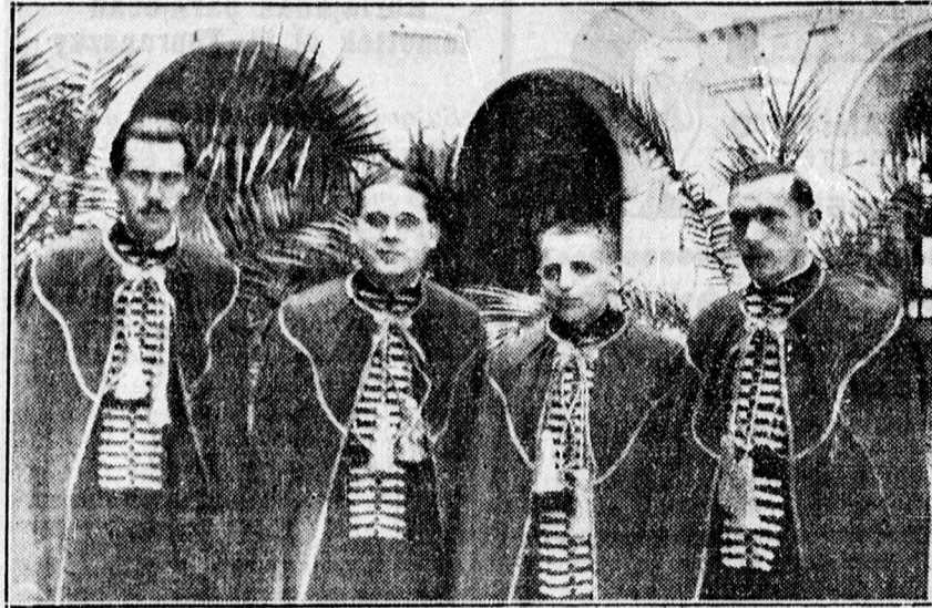
Tegnap felavart új doktorok.

— Új öt és tízfrankos papírpénzeket hoztak forgalomba Franciaországban. Az új bankjegyek teljesen hasonlóak az 1914-ben kibocsátott és utóbb bevont papírpénzekhez.