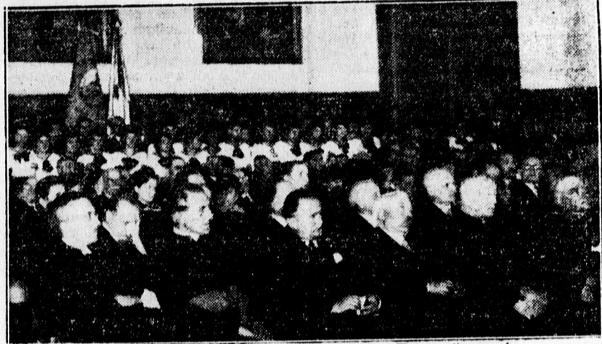
Közönség a debreceni Marcia su Roma ünnepén.