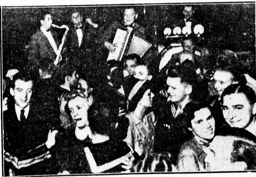
Varsóban már táncol az ifjúság

Elmúlt több mint hat esztendő. Közben a felszedült leányanya férjhez is ment. Tavaly májusban átalakították Panyorék lakását, mesteremberek dol-