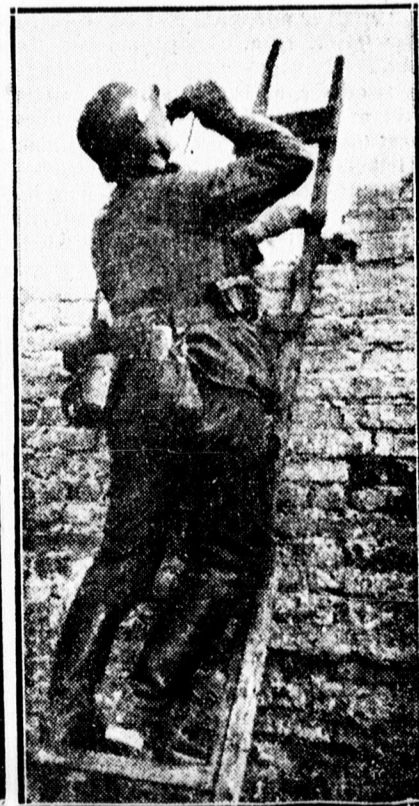
A nyugati frontról: Repülőgép közeliedik!