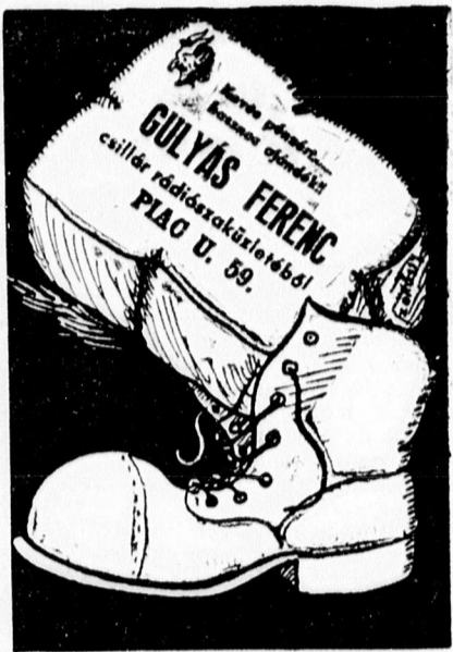
kezett emelkedésekre is, (munkabér, fuvar).

Budapest, nov. 30. A tűzifaárak tekintetében az utóbbi időben mutatkozó bizonytalanság szükségessé tette, hogy ennek a fontos közszükségleti cikknek eladási ára egységesen szabályoztassék. Az árkormánybiztos rendelete külön szabályozza a termelők részéről felszámítható árakat, továbbá a kereskedők, illetve kiskereskedők eladási árát is. A rendelet 330 pengős vagononkénti bükkszén árát állapítja meg Budapesten, — ennek alapján a fogyasztói ára 2 mázszánál nagyobb tételekben aprítva, házhoz szállítással együtt 4.80-ban van megállapítva. 2 mázszánál kisebb tételek ára a vevő lakására szállítással együtt 6 pengő. Az egyéb fánemek, illetve választékok eladási árát megfelelően olcsóbbak. Ezek az árak általában az augusztus 26-án fennállott fogyasztói áraknak megfelelőek. Az árkormánybiztos rendelete a fogyasztók közönség hátránya nélkül vette figyelembe a kereskedelemben különféle törvényes intézkedések során bekövetkezett költségnövekedéseket, tekintettel van a termelői költségekben az utóbbi időben több vonatkozásban bekövet-