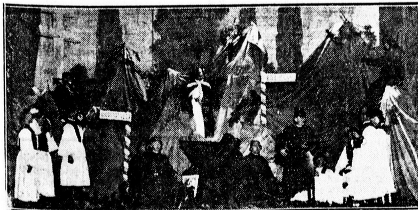
Képek a Borbála-ünnepélyről. Fent az előkelőségek. Lent: Hatásos előkép.