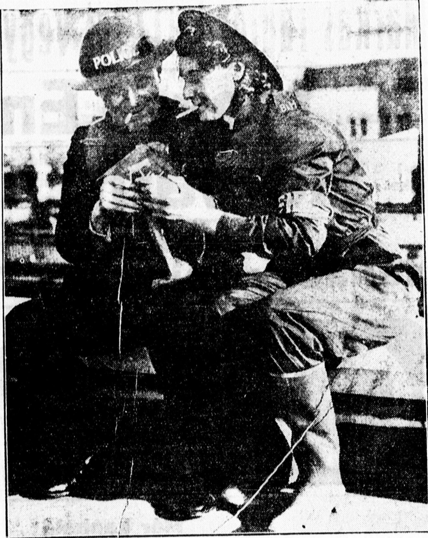
Angliában női rendőröket alkalmaznak. Mint a képen látható szívvel barátkoznak férfi kollégáikkal.