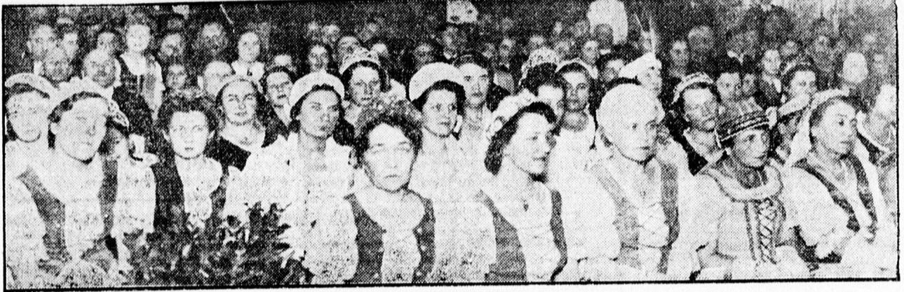
Nemzetes asszonyok a Vitézi Szék Miklós-napi estélyén az Arany Bika dísztermében.