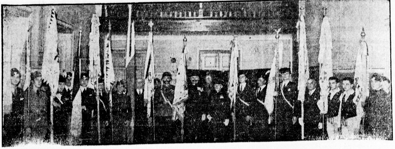
Zászlótarok zászlóikkal a Vitézi Szék Miklós estélyén.

Remek konyhával, válogatott fajborokkal, hangulatos cigányzenével várja kedves vendégeit a volt miskolci BÜZÖGÖ.