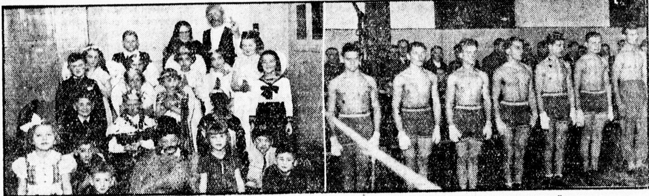
Postás MANSZ karácsonyfa-ünnepélynek szereplői.

Magyaros iparművészeti ajándéktárgyakat, olesó játékokat vásároljon HELLER esztergályvesnél, Széchenyi-utca 1. (Révész-tér 1.)