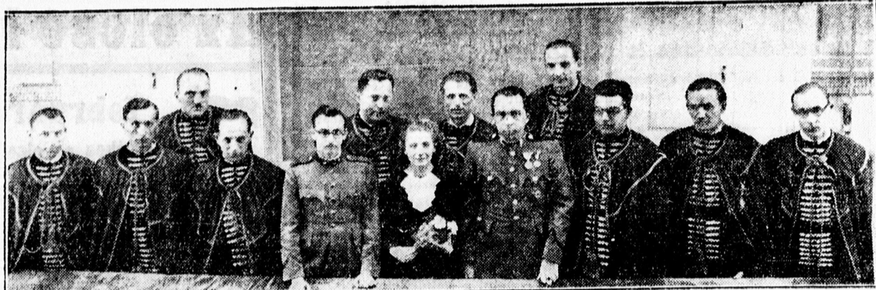
A tegnap felavatott új doktorok.

— 108 éves korában meghalt Keeskménen öz. Begidsán Kris- tine. Az elhunyt asszony család- jának tagjai mind hosszúéletűek voltak, egyikük 120 évig élt.