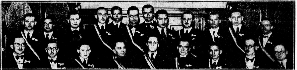
Fent: Első hálózó leányok csoportja az Árpád B. E. táncestélyén az Arany Bika dísztermében, Lent: Árpád B. E. díszteremének rendezőbizottsága.

x Mielőtt kályhát vesz, tekintse meg Krisch cserépkályharaktárát, ahol Magyarország egyik legjobb és legjobb kályháiból nagy választékot talál. Válasszon minden szakmába vágó munkát. Debrecen, Ispóty-tér 1.szám, telefon: 12-18. szám, (Nagyállomásnál).