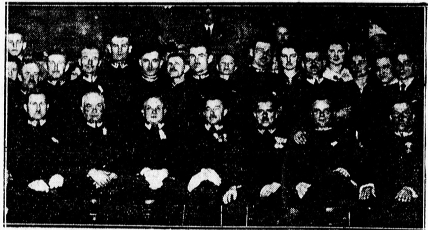
A Postás-hál rendezői.