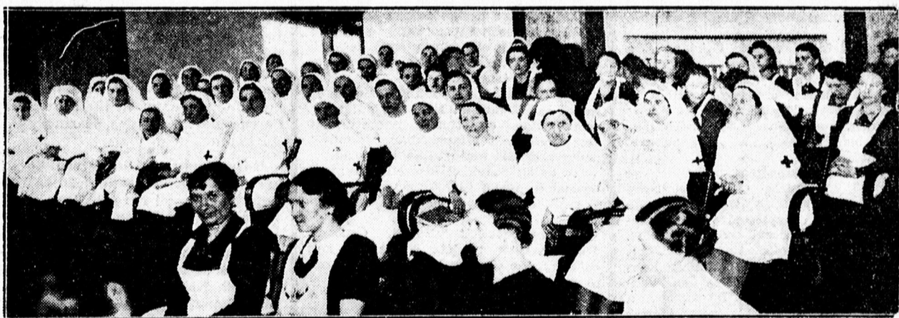
Az ápolónői tanfolyam vizsgázott növendékei a záróvizsga után.