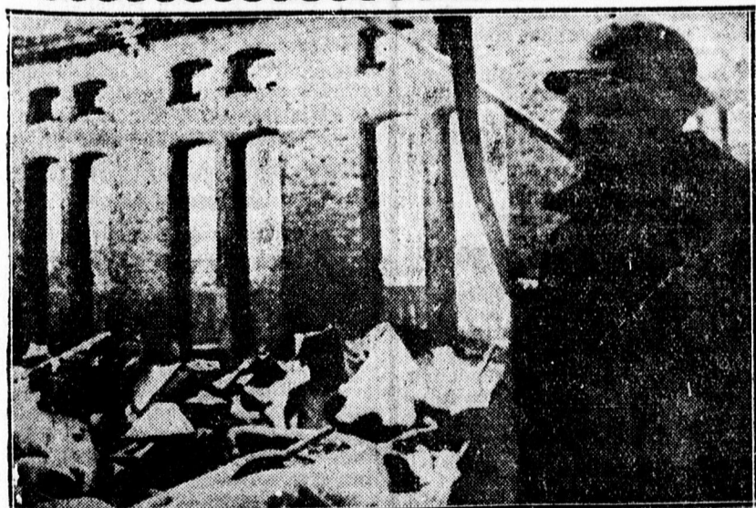
A helsinki technikai főiskolából ennyi maradt meg a szovjet repülőek támadása után.

Egymásután érkeztek ellene a feljelentések. Elfogatása alkalmával orvosi kézitáskájában a legmodernebb villanyforrasztó készüléket, finomművű alkulesokat találtak. Zsebében vasúti szabadjegy volt, amelyről kiderült, hogy egy vidéki gimnáziumi tanártól tulajdonította el. Kihallgatása során a kalandos, hányatott életű ékszerügnök bevallotta, hogy Debrecenben, Hajduszoboszlón, Szarvason, Szegeden, a Dunántúl úgyszólván valamennyi városában a szélhámosságok sorozatát követte el. A rendőrség má-