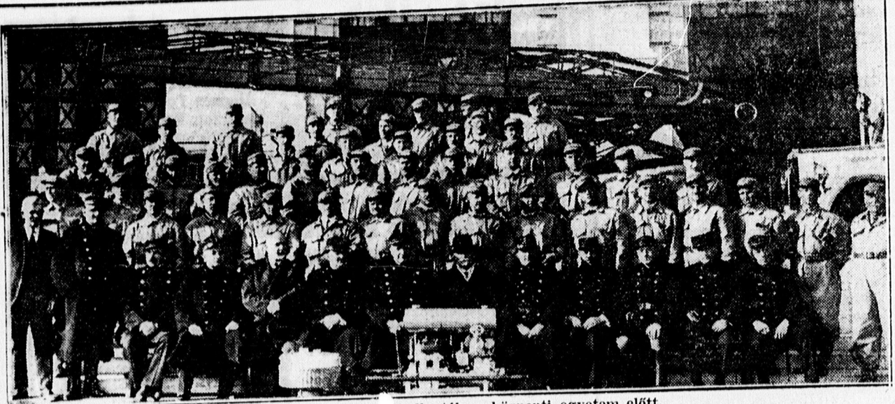
A tüzoltótanfolyam vezetősége és hallgatók a központi egyetem előtt.

x A Késmárki Diákszövetség május ötödikén, vasárnap délután 5 órakor Budapesten, Vas ucca 11. szám alatt a gróf Széchenyi István felsőkereskedelmi iskola III. emelet 41. számú termében tartja XII. évi rendes közgyűlését. Ezt követően este félkilenc órakor vacsora a Pannónia szálló (Rákóczi út 5.) éttermében, ahol az 1900, 1905, 1910, 1915 és az 1900 előtt érettségizett liceumi és kereskedelmi iskolai diákok is találkoznak. Ez időben nemzetközi vásár 50 százalékos vasúti kedvezmény. Bejelentés VIII. Vas ucca 11. Vendégeket szívesen látunk.