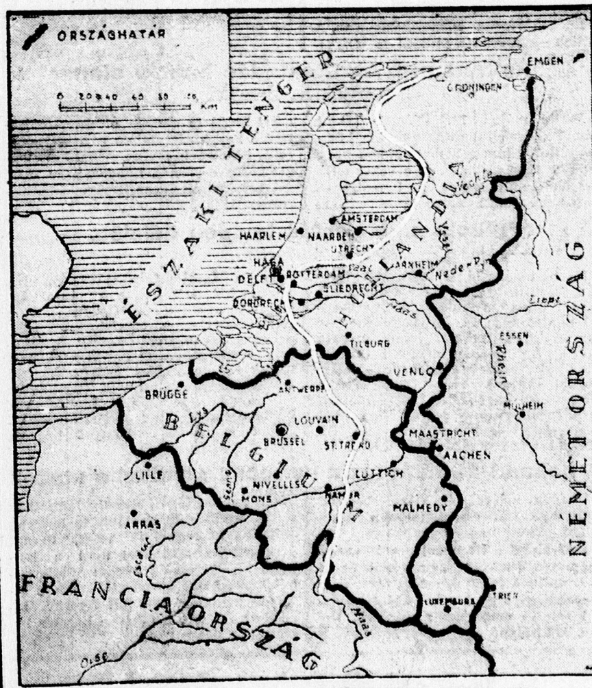
A fehérvonallal jelzett rész a valószínű harc vonal kedden este.

Mikor e sorokat az éjfél órákban írjuk, érkezik Berlinből a hivatalos jelentés, mely hírül adja, hogy a holland csapatok főparancsnoka Rotterdam megadásának, valamint Utrecht és Hága küszöbönálló elfoglalásának hatása alatt az egész holland hadseregnek megparancsolta a fegyverek letételét. Ezzel tagadhatatlanul nagy előnyre tett szert a nyugaton küzdő német haderő, mely most északról és keletről fejthet ki nyomást a szövetségesek haderejére, mely új védelmi vonalra akarja felvenni a küzdelmet. Az éjszakai francia hadijelentés azt mondja, hogy a német csapatok előnyomulását sikerült megállítani, ezzel szemben ugyanezen éjjel érkezett berlini jelentés azt mondja, hogy a német csapatok Dél-Bel-