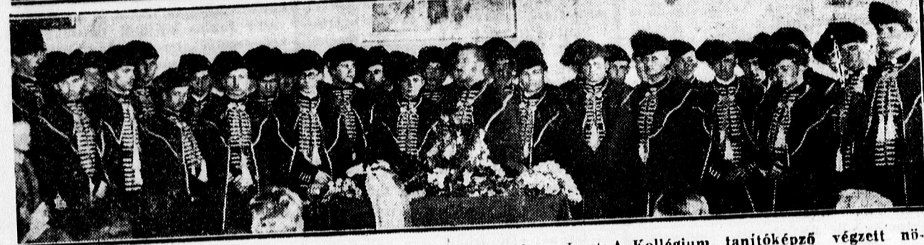
Fent: A Dóczy tanítóképző végzett növendékei a ballagás után. — Lent: A Kollégium tanítóképző végzett növendékei ősi diákviselésben „ballagtak” azután a díszteremben volt szép ünnepély.

— Harminctagú japán küldöttség érkezett Olaszországba, ahol megtekinti az olasz grammatikai kiállítást s tárgyalásokat folytatnak az olasz-japán kereskedelmi forgalom fejlesztéséről, valamint kulturális eseményekről.