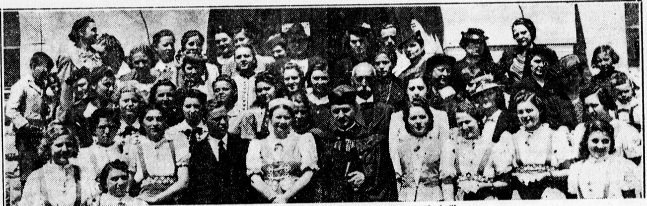
Mester uccai leánykör 10 éves jubileumi ünnepségéről.