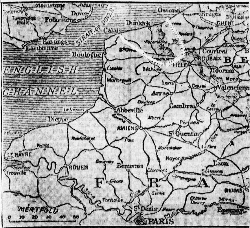
A fehér vonal a bekerített szövetséges haderő helyzetét ábrázolja.