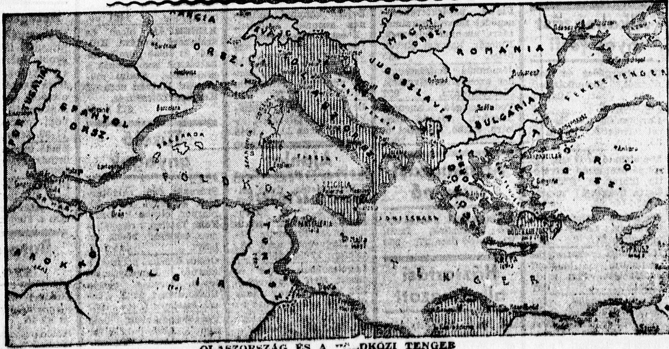
OLASZORSZÁG ES A FÖLDKÖZI TENGE