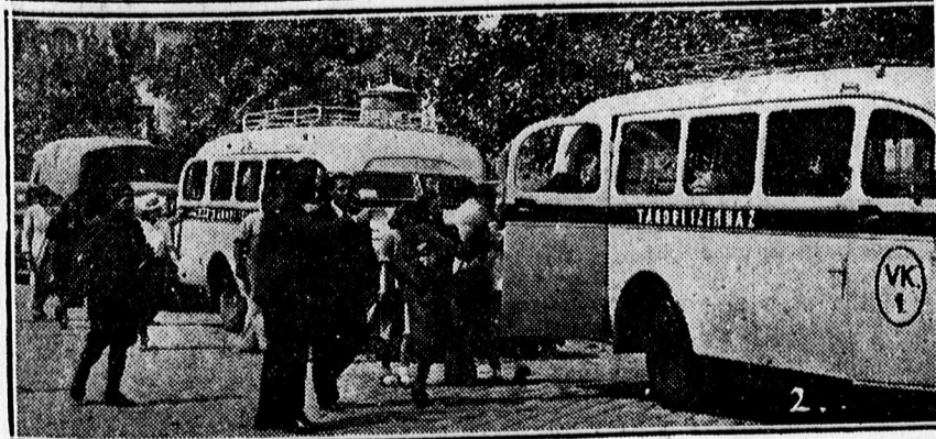
1. A Tábori Színház társulatának tagjai Debrecenen átutazva rövid pihenőt tartanak az Angol Királynő-ben, 2. Beszállás... A Tábori Színház társulata elutazik autóbusszain Debrecenből.