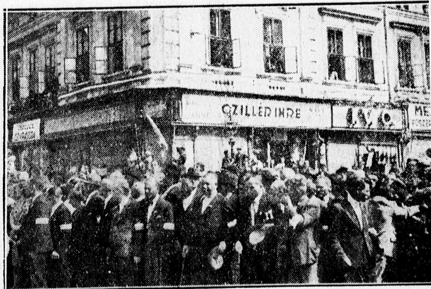
Nagyvárad frontarcosok sorfala mögött óriási tömeg a Szent László tér sarkán.