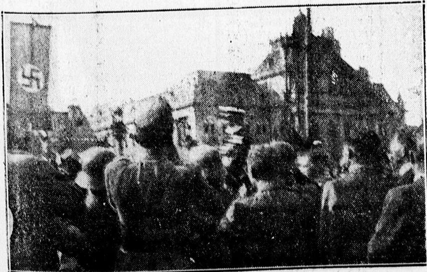
A kormányzó Nagyváradon: lónáton a díszemelvény elé érkezik.

Várad örömeiben tobzódozó város. Minden üzlet, bolt, kereskedés, vállalat, iroda, dohánytözsde, sokhelyütt