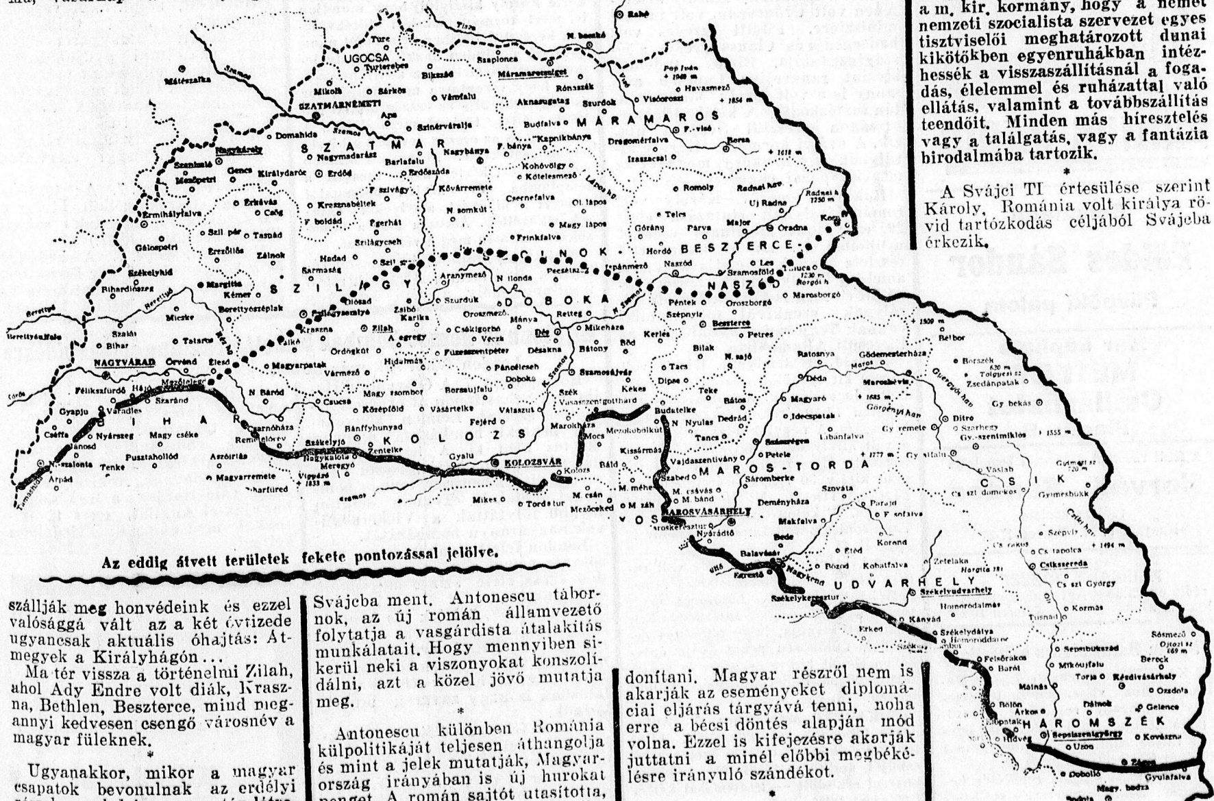
Az eddig átvett területek fekete pontozással jelölve.

A Svájci TI értesülése szerint Károly, Románia volt királyja rövid tartózkodás céljából Svájcba érkezik.