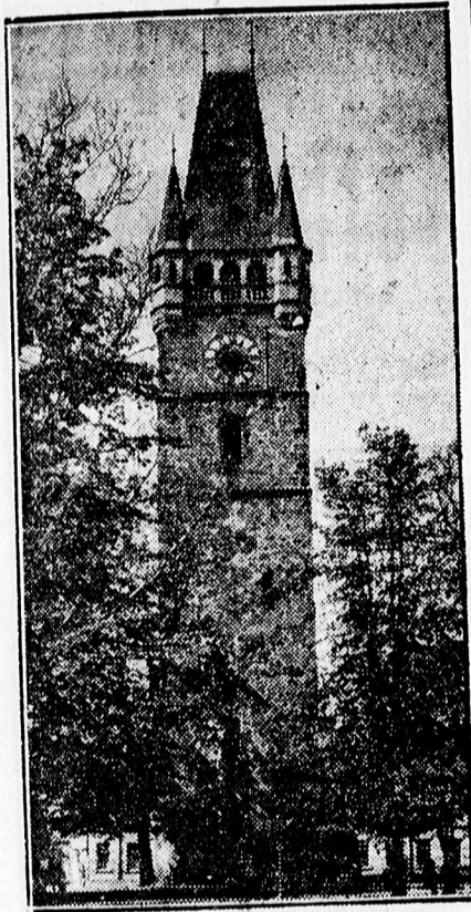
Nagybánya Szent István-torony.