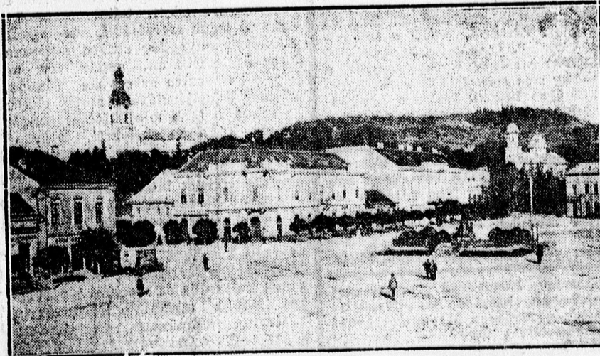
A visszatért Zilah

védereg átlépte Erdély kapuját, a Királyhágót. Krasznára virággal borított úton vonultak a honvédek. Hangzúgás közben érték el Zsibót, a Wesselényiek fészket. Zilah felé azon az úton vezetett a honvédek