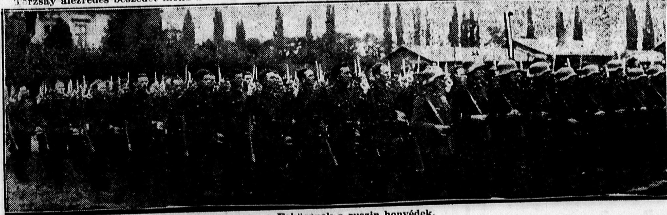
Esküsznek a ruszin honvédek.