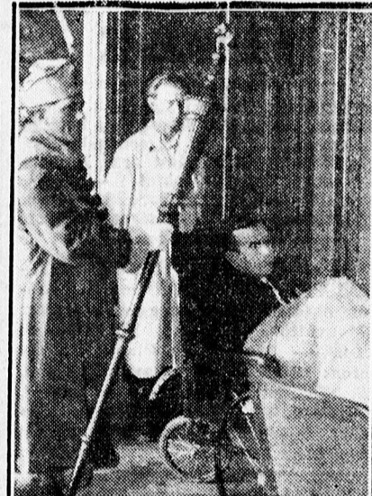
Akit tolószékekben avattak doktorrá.

A rektor szívből jövő szavai után a megható aktus véget ért.